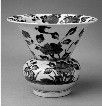
Afb.2 Kwispedoor, h.17,2 cm, Arita, Japan 1671-1690 (Groninger Museum)

in Amsterdam, maar overleed al op 21 februari 1711, nog geen acht maanden na aankomst in Nederland. Na zijn overlijden werd een staat en inventaris van de nagelaten bezittingen en schulden opgemaakt. 10 Hij liet het voor die tijd fabelachtige vermogen na van bijna 1,5 miljoen gulden, waaronder een groot aantal waardepapieren en veel Oost-Indische en Japanse voorwerpen, zoals textiel en porselein.