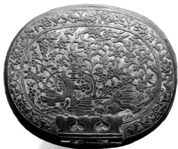
Afb.3 In Amsterdam gevonden Sawasa tabaksdoos, 18 de eeuw. (privé collectie)

Kostbaar zijn de zeven gouden snuifdoosjes met een waarde van ruim 381 gulden, vier zilveren tabaksdozen van 72 gulden en zeven zilveren kwispedoores van 122 gulden. Van nog een andere zilveren kwispedoor en een zilveren tabakskomfoor is de waarde niet bekend. Bijzonder is het Japans en Tonkins rookgerei tussen het bezit van Van Hoorn. Mogelijk had hij dit op bestelling naar Batavia over laten komen. In de zijkamer staan nog twee goedkope kwispedoortjens van Japans lakwerk die samen op een gulden worden gewaardeerd. Daarnaast heeft hij drie tabaksdozen, vijf snuifdoosjes van 'Japans savas' en drie tabaksdozen en negen snuifdoosjes van 'Tonquins savas'. Sawasa werd in de achttiende eeuw tegelijkertijd in Japan en Tonkin (het noorden van het huidige Vietnam) vervaardigd. 12 Het is een legering van koper met diverse