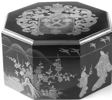
Afb. 7. Japans doosje in goudlak uit bezit Joan van Hoorn.

Kennelijk was de pijpenmaker, die de vormgraveur opdracht gaf de persvorm te snijden, niet op de hoogte van de juiste voorstelling van het wapen. Het wapen op de pijp is namelijk een hoorn zonder riem op een geruwde ondergrond, terwijl het wapen van Joan van Hoorn drie sterren rond een hoorn met een riem heeft. 16 (afb. 6) In het Rijksmuseum te Amsterdam bevindt zich een achtkantig gelakt Japans doosje uit het bezit van Joan van Hoorn waarop het familiewapen met sterren is afgebeeld. (afb. 7)